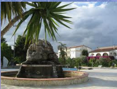
P.zza De Mundo con al centro la fontana

Edificata di recente, si adagia sul litorale del Mar Ionio, mare del mito e della storia, mare della Magna Grecia. Offre un'ampissima spiaggia e delle acque limpide e nel periodo estivo, un calendario di eventi e spettacoli serali nella piazza DE MUNDO